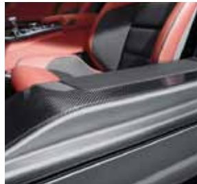
Einstiegsleiste Carbon, AMG Carbon-Paket Interieur