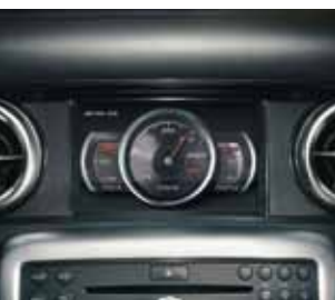
AMG Performance Media