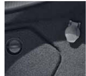
Vorrüstung für Batterieladegerät im Kofferraum