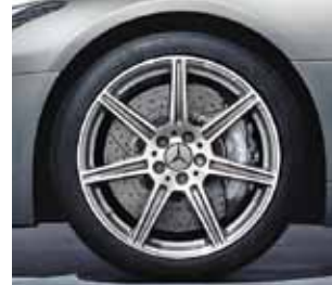
7-Speichen-Design (Code 765)