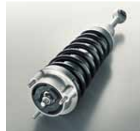
AMG Performance Fahrwerk