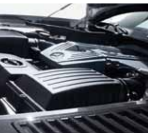
AMG Carbon Motorraumabdeckung