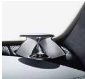
Hochtöner, Bang & Olufsen BeoSound AMG