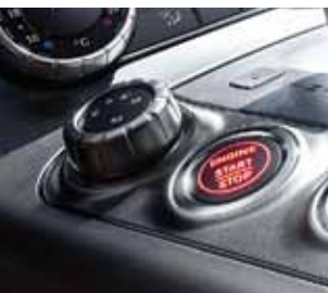
AMG DRIVE UNIT