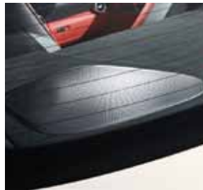
Subwoofer, Bang & Olufsen BeoSound AMG