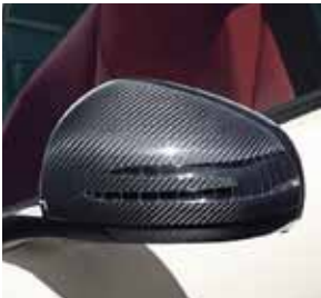
AMG Carbon Außenspiegel