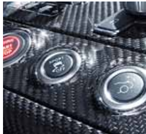
AMG Zierelemente Carbon