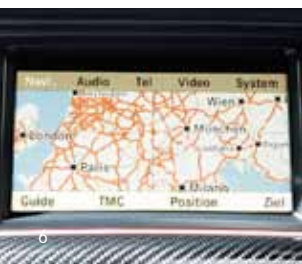
Navigationssystem COMAND APS