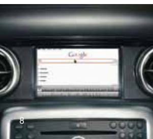
AMG Performance Media