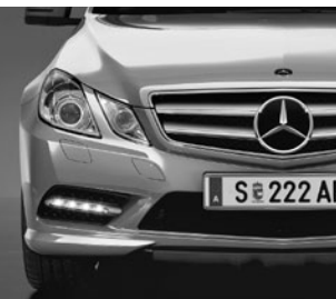
AMG Frontschürze 6)