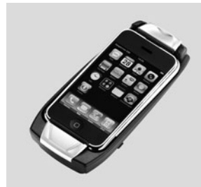
Aufnahmeschale für Apple iPhone