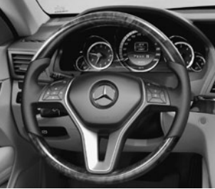
ELEGANCE Cockpit 1)