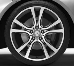
5-Doppelspeichen-Design (R 17)