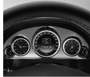
Kombiinstrument in Tubenoptik

Außenspiegel links und rechts beheizt, von innen elektrisch einstellbar und in Wagenfarbe lackiert sowie mit asphärisch gewölbtem Spiegelglas und integrierter Blinkleuchte