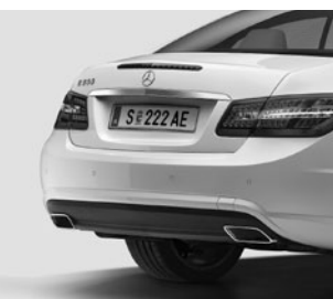
AMG Heckschürze 6)