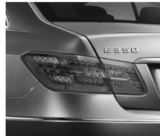
Heckleuchten in LED-Ausführung