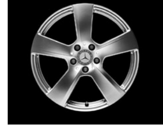
5-Speichen-Design (Code R32)

Bremssättel vorne lackiert mit Mercedes-Benz-Schriftzug