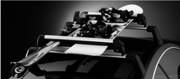
Grundträger Alustyle, Ski- und Snowboardhalter New Alustyle