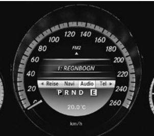
Display in TFT-Technologie