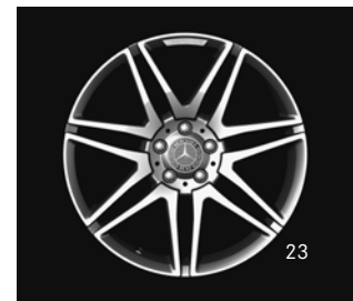
AMG 7-Doppelsp.-Design (770)