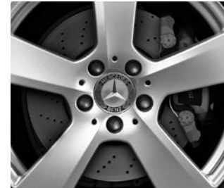
Bremsscheiben vorne gelocht