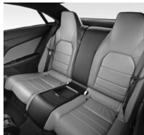
Fondsitze Leder schwarz/flamencorot