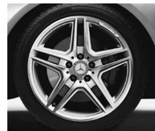
AMG 5-Doppelsp.-Design (795)