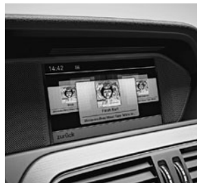
COMAND Online (527)