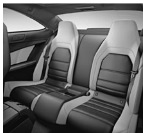
C 63 AMG Fond designo Leder zweifarbig in designo Leder porzellan/schwarz