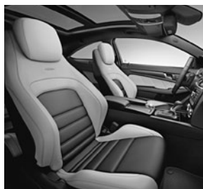
C 63 AMG designo Leder zweifarbig in designo Leder porzellan/schwarz