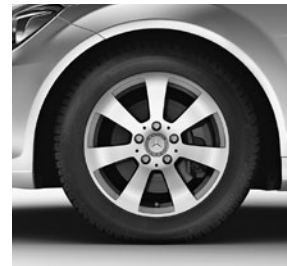
40,6 cm (16") Leichtmetallräder im 7-Speichen-Design (R20, R75)