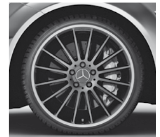
48,3 cm (19") AMG Leichtmetallrad Vielspeichen-D. Mattschwarz (797)