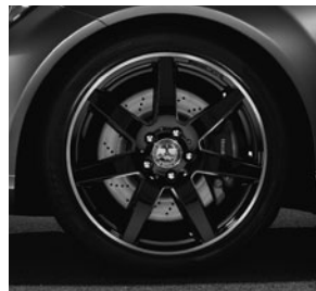
AMG Leichtmetallräder im 7-Doppelspeichen-Design