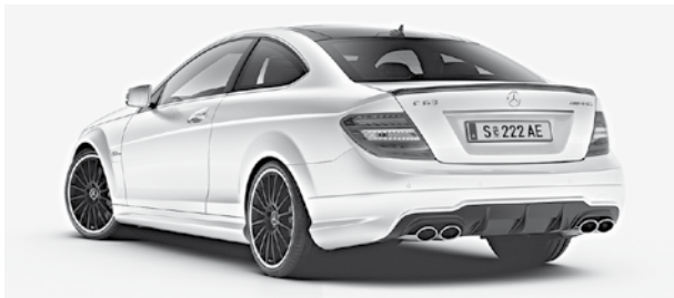
C 63 AMG mit AMG Performance Package