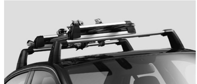
Grundträger Alustyle, Ski- und Snowboardhalter New Alustyle