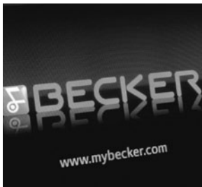
Becker® MAP PILOT (509)