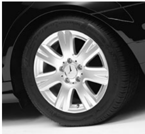
40,6 cm (16") Leichtmetallräder Pristix im 7-Speichen-Design