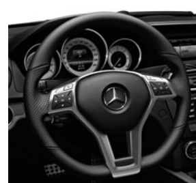
3-Speichen-Multifunktions-Sportlenkrad, unten abgeflacht