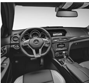
Erweiterte Ausstattung in designo Leder schwarz