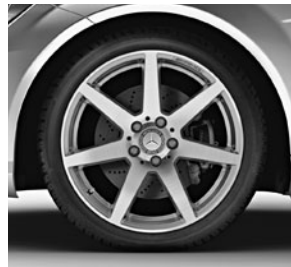
45,7 cm (18") AMG Leichtmetallrad im 7-Speichen-Design (782)