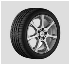
43,2 cm (17") Leichtmetallräder im 7-Speichen Design