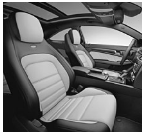
designo Leder zweifarbig in designo Leder porzellan/schwarz