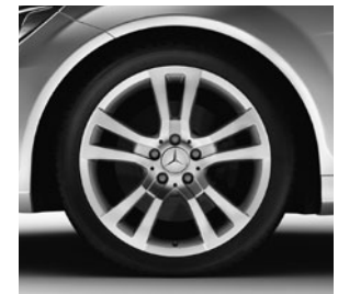
45,7cm (18") Leichtmetallräder Pulaha im 5-Doppelsp.-Design