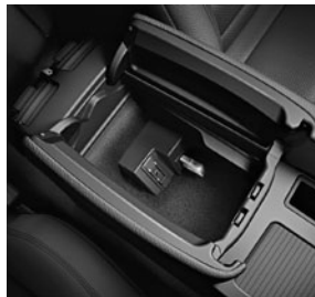
USB-Schnittstelle und AUX-IN Anschluss in der Mittelkonsole