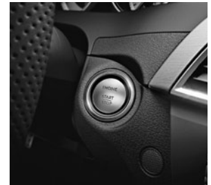
KEYLESS-GO (Code 889)