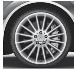
48,3 cm (19") AMG Leichtmetallrad Vielspeichen-Design Titangrau (788)