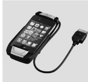
Aufnahmeschale für Apple iPhone