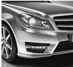
Intelligent Light System (622)