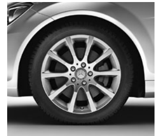
43,2 cm (17") Leichtmetallräder im 10-Speichen-Design (25R)