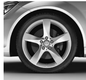
45,7 cm (18") Leichtmetallräder im 5-Speichen-Design (R36)