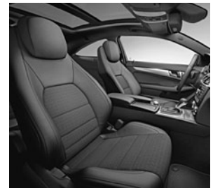
Coupé-Sitzanlage mit integrierten Kopfstützen