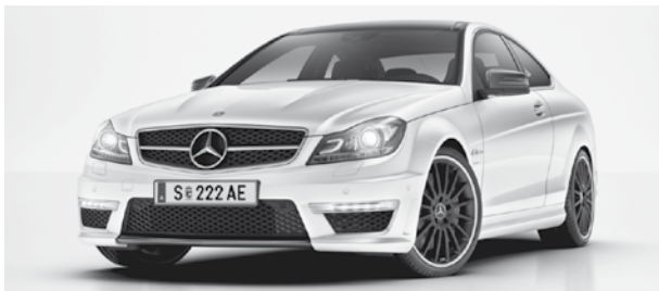
C 63 AMG mit AMG Carbonpaket Exterior