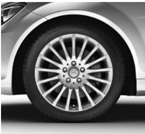
43,2 cm (17") Leichtmetallräder im Vielspeichen-Design (56R)