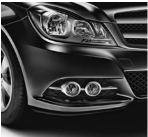
Abgedunkelte Scheinwerfer mit Tagfahrlicht und Nebelscheinwerfer