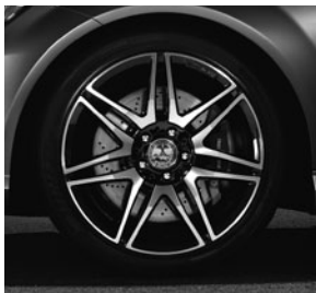
AMG Leichtmetallräder im 7-Doppelspeichen-Design

1) Auslieferung voraussichtlich 3. Quartal 2012.