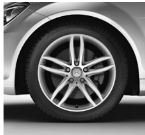
43,2 cm (17") Leichtmetallräder im 5-Speichen-Design (R95)