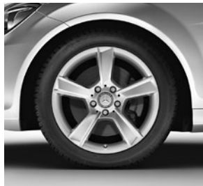
43,2 cm (17") Leichtmetallräder im 5-Speichen-Design (639)