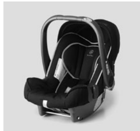
Kindersitz BabySafe Plus II