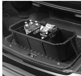
Kofferraumwanne, flach mit Staubox