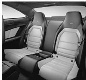
Fond designo Leder zweifarbig in designo Leder porzellan/schwarz