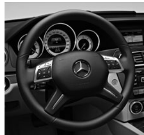
3-Speichen-Multifunktionslenkrad mit 12 Tasten