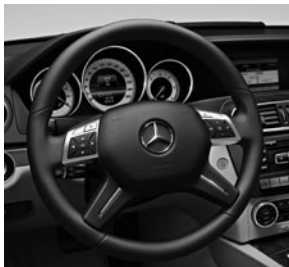
3-Speichen-Multifunktions-Sportlenkrad unten abgeflacht