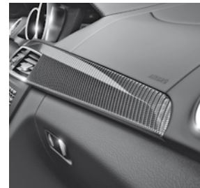
AMG Zierelemente Carbon