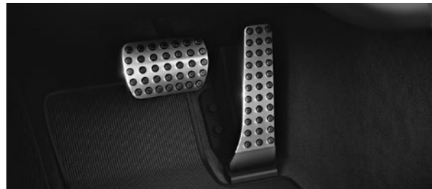
Sportpedalanlage aus gebürstetem Edelstahl mit Gumminoppen