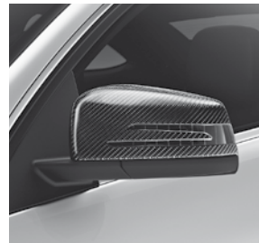
AMG Carbonpaket Exterior