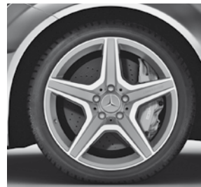
45,7 cm (18") AMG Leichtmetallrad im 5-Speichen-Design (790)