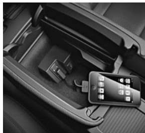
Media Interface (518)